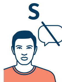
DIFICULTAD PARA HABLAR