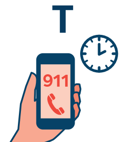
TIEMPO DE LLAMAR AL 911

Actúe rápido y llame al 911 inmediatamente.